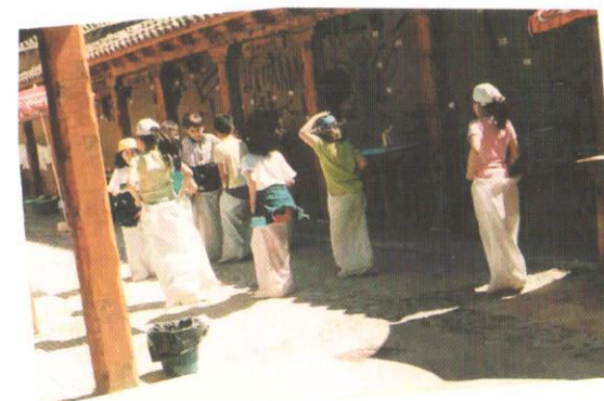
Carrera de sacos