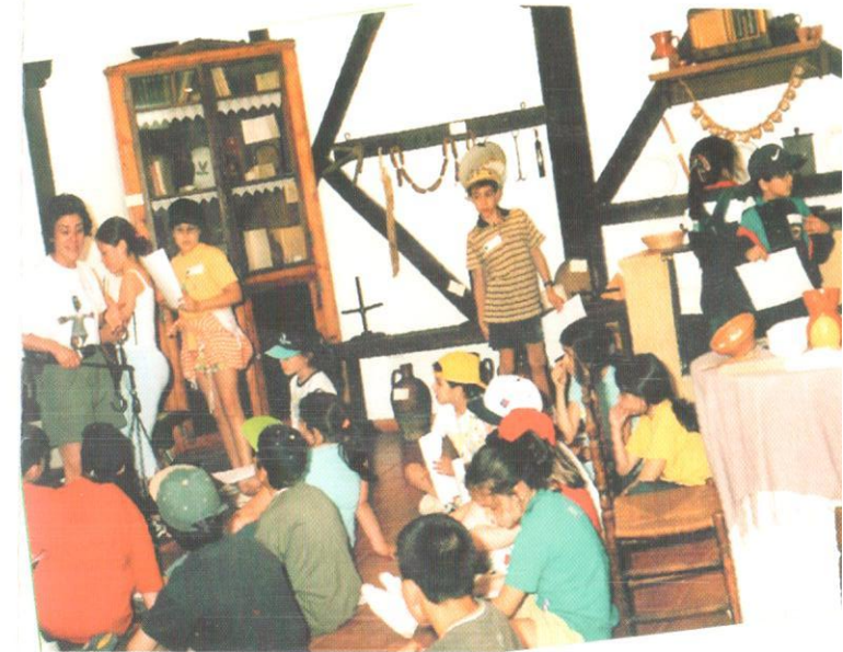
Entre los cacharros de la cocina