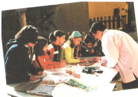
Jugando a la OCA

Relacionado con pruebas tan divertidas como: lavar con tabla, reconocer aromas de plantas medicinales, investigar sobre oficios tradicionales y sus herramientas,... y un montón de juegos que tendrás que superar si vienes a vernos.